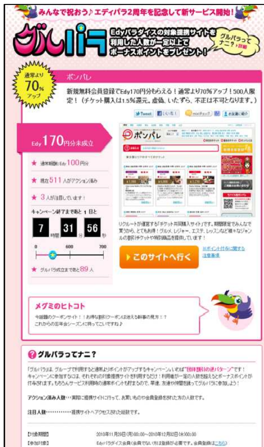
【「グルパラ」イメージ画面】(左:PC、右:モバイル)